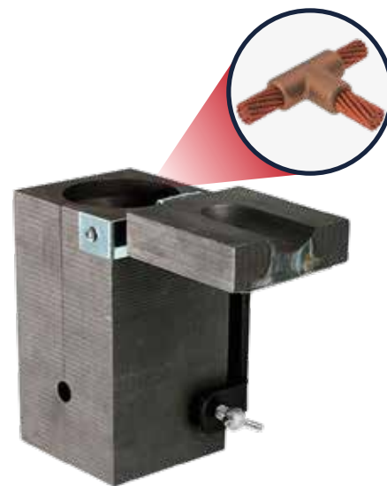
TABLA DE PRODUCTO

Valmact® fabrica una gran variedad de moldes y también se fabrican moldes especiales de acuerdo a las necesidades del cliente.