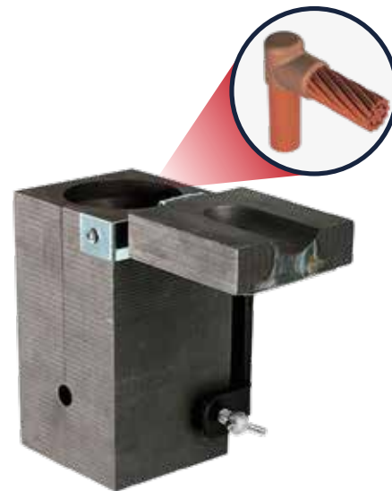
TABLA DE PRODUCTO

Valmact® fabrica una gran variedad de moldes y también se fabrican moldes especiales de acuerdo a las necesidades del cliente.