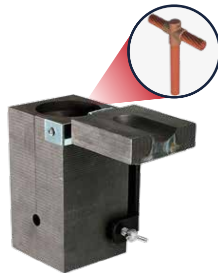
TABLA DE PRODUCTO

Valmact® fabrica una gran variedad de moldes y también se fabrican moldes especiales de acuerdo a las necesidades del cliente.